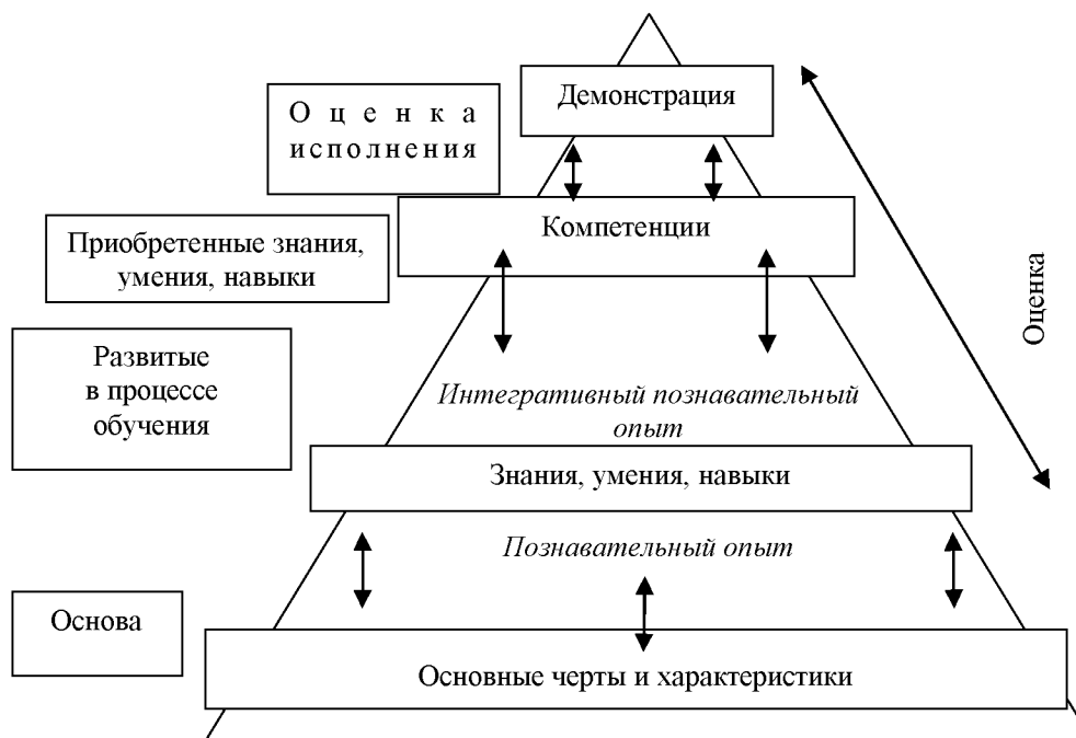
Рис. 1. Структура компетенции по E. Jones, R. Voorhees, K. Paulson

Проводя границы между терминами, призванными описать планируемые результаты образовательного процесса и обучающихся в частности, и визуально дифференцируя их, авторы документа «Определение и оценка обучения: изучение инициатив на базе компетенций» (Отчёт совместной рабочей группы по сотрудничеству в сфере национального высшего образования об инициативах на базе компетенций в высшем образовании) приходят к следующей структуре компетенции (рис. 1.) [19, с. 8].